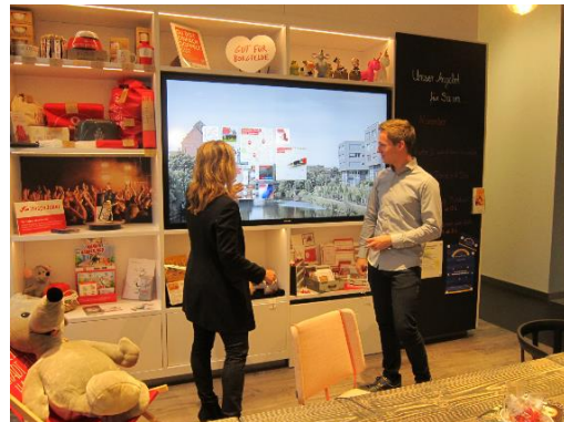
Besuch der „Filiale der Zukunft“ der Hamburger Sparkasse am Wikingeweg im Rahmen der Studienfahrt der Bankfachklasse im November 2018

Der Finanzbereich ist einer derjenigen Branchen, die sich in den letzten Jahren am stärksten weiterentwickelt haben. Es kommen ständig neue Produkte auf den Markt, die Technik schreitet sehr schnell voran, so dass Bankkaufleute ständig bereit sein müssen, neue Dinge schnell zu erlernen und umzusetzen. In der späteren Praxis haben es Bankkaufleute mit einer sehr großen Produktpalette zu tun, welche oft sehr detailliertes Produktwissen erforderlich macht. Je nachdem, in welchem speziellen Bereich man tätig ist, sind Arbeiten im Servicebereich, in der Kundenberatung und in den verschiedenen Fachabteilungen wie Kreditfinanzierung oder im Wertpapierbereich zu bewältigen. Das Aufgabengebiet der Bankkaufleute erstreckt sich also von der Hausfinanzierung bis hin zu einer umfassenden Anlageberatung mit den verschiedenen Anlageprodukten aus dem Bereich Wertpapiere, Bausparen, Versicherungen und Altersvorsorge. Im internen Bereich eines Kreditinstituts planen und steuern sie Arbeitsabläufe. Darüber hinaus führen sie Kontrollen im Rechnungswesen durch und überwachen die Einhaltung gesetzlicher Vorschriften und innerbetrieblicher Richtlinien. Auch Tätigkeiten im Personalwesen können in ihren Aufgabenbereich fallen.